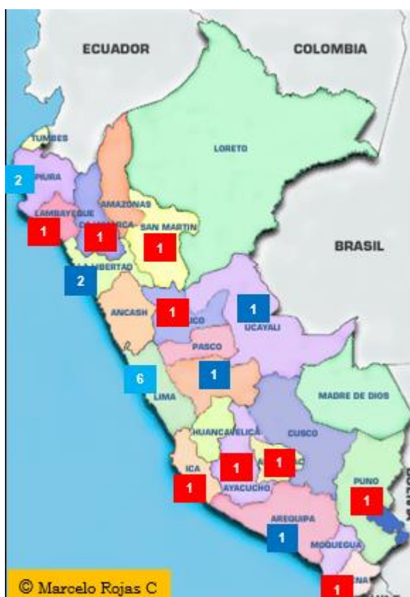
Fig 1. Distribución geográfica y Regional de las Facultades de Medicina Veterinaria o Medicina Veterinaria y Zootecnia

En la Fig 1, se muestra la distribución Regional (No Departamental) de las Facultades o Escuelas Académicas. La cantidad en fondo rojo, son públicas, en fondo azul, privadas, y en fondo azul claro: públicas y privadas [en Lima hay una publica y cinco privadas].