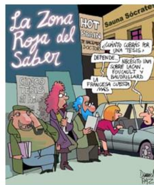
Fig 2. La Autoría inmoral en la Tesis de Grado