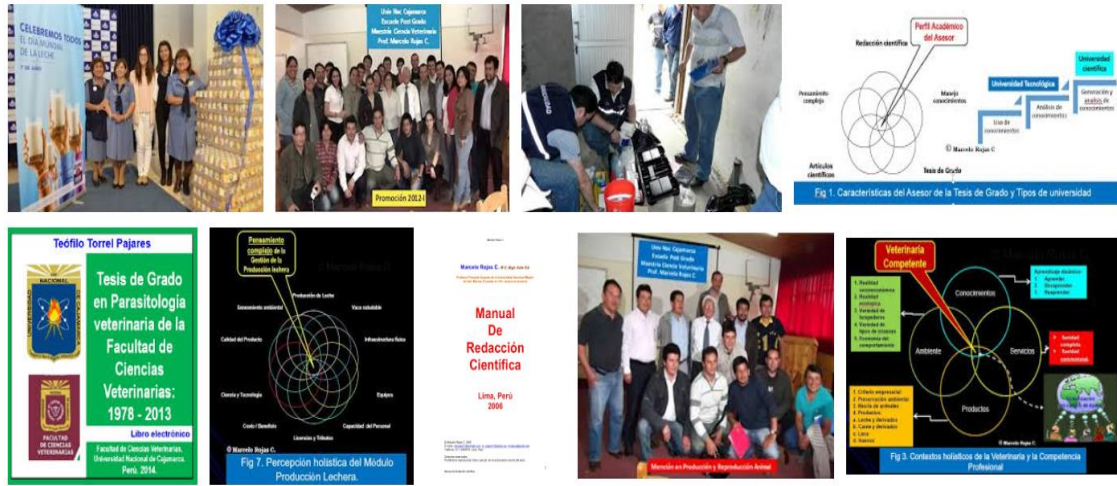
Fig 4. Diversas imágenes y mapas mentales en la Inteligencia artificial de Google