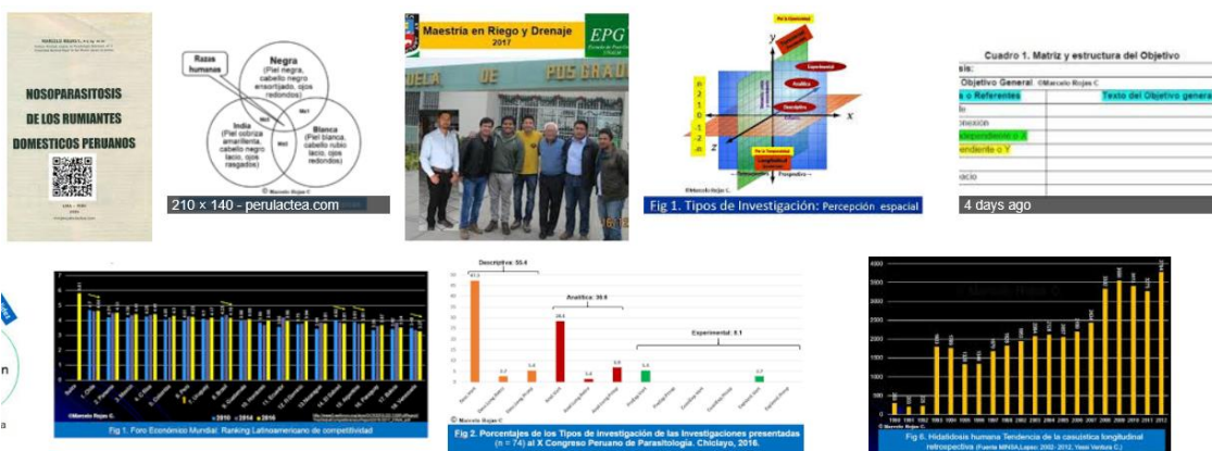
Fig 2. Diversas imágenes y mapas mentales en la Inteligencia artificial de Google