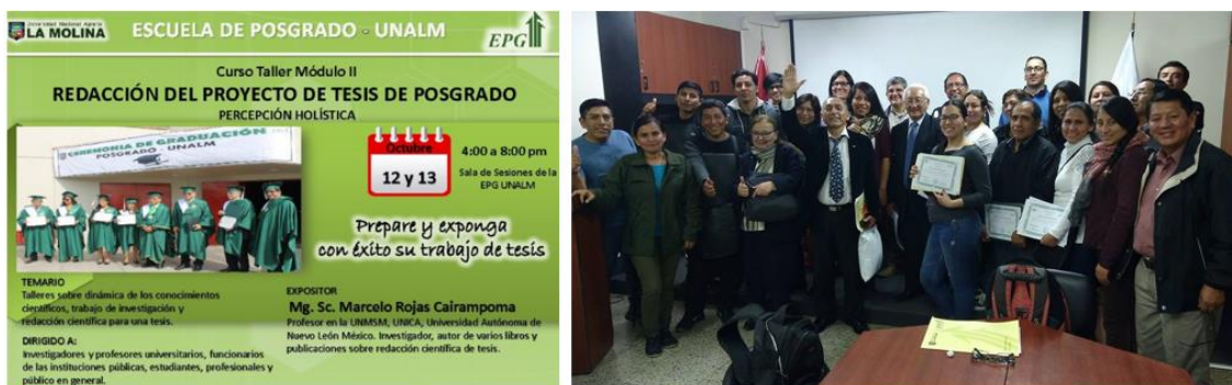
Fig1. Convocatoria y participantes del evento

A convocatoria de la Escuela de Post Grado de la Universidad Nacional Agraria, se realizó el evento (Fig 1), con una gama de participantes, entre ellos: seis ecuatorianos y los restantes, en gran mayoría de Provincias del interior del Perú; de distintos niveles académico: Maestrandos, Maestros, Doctorandos, Doctores y Pre Graduandos.