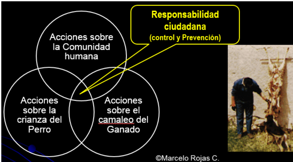
Fig 2. Competencia principal para el control de la Hidatidosis