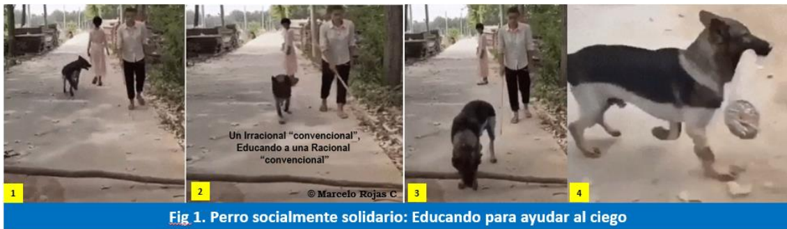
Fig 1. Perro socialmente solidario: Educando para ayudar al ciego

Se debe advertir que, es una Asignatura transdisciplinar para la conducta animal ; muy distinta a la Asignatura, que las hay en algunos Planes de estudios, como Psicología General, que aborda la Psicología del aprendizaje del Alumno .