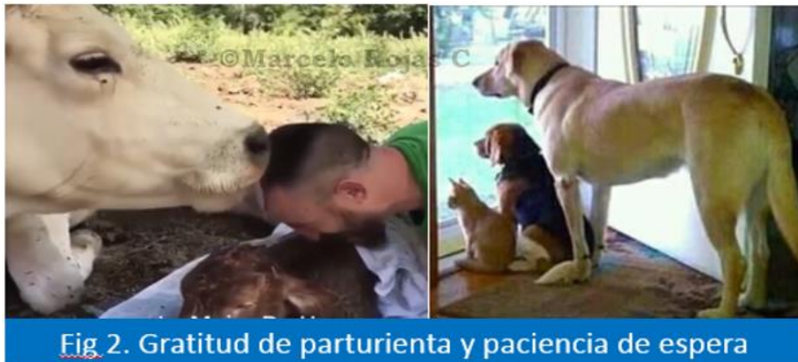
Fig 2. Gratitud de parturienta y paciencia de espera